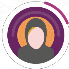
مديرة إدارة تنمية الموارد المالية هاجر بخيت الحبيشي