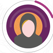
المديرة التنفيذية: ابتسام مساعد الجهني