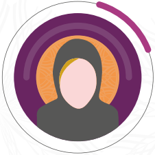
المحاسبة: بشاير فهد الجهني