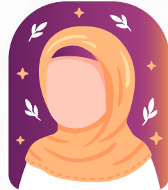
بشاير فهد الجهني المحاسبة